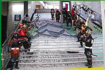
古川氏寄贈の小田原駅西口階段アート

2023年 11/13 (月) 18:30～20:00 (開場 18:00) 〈会場〉 小田原市生涯学習センターけやきホール